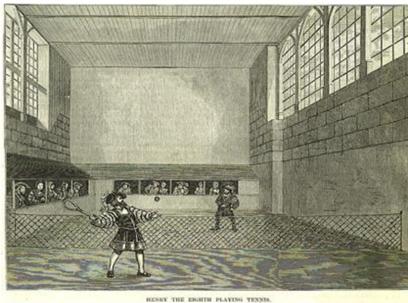
Рис. 5. Игра в теннис в средние века

Прообраз тенниса процветал во Франции в специальных домах мяча, которых насчитывалось в 1602 г. несколько сотен. Из истории так же известно, что в 1610 г. во Франции союз тренеров и изготовителей ракеток и мячей был признан самостоятельным цехом. Англичанин Р.Дарлингстон (1560–1620 гг.) в примечаниях о поездке по Франции отметил, что домов игры в мяч больше чем костелов. Французы рождаются с ракеткой в руке (рис. 4). Игры носили больше развлекательный и гимнастический характер, чем спортивный.