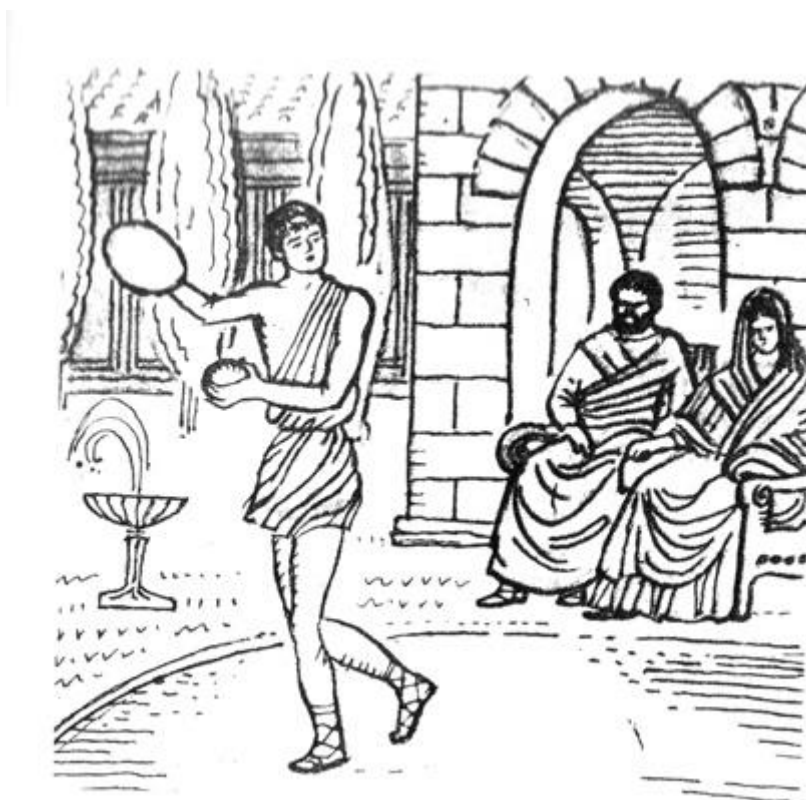
Рис. 2. Игра в мяч Фоллис

Приблизительно в те же времена была распространена похожая игра – фоллис , в которой перебрасывался полый шар величиной с детскую головку. Вместо ракеток использовались специальные надетые на руку щиты (рис.2).