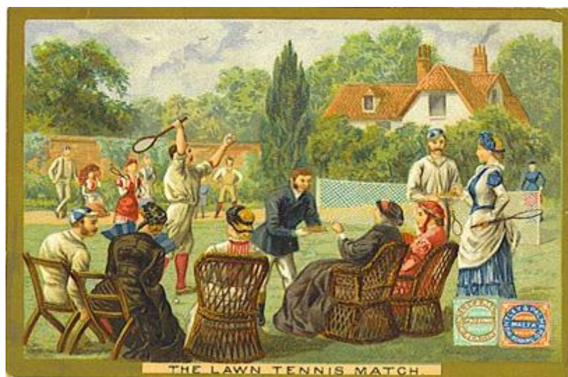
Рис. 6. Игра в лаун-теннис.

В 1874 году английский майор Вальтер Клоптон из Вингфилда разработал правила новой, довольно близкой к современному теннису игры, которую он назвал сферистика. Через год правила игры были усовершенствованы, и она получила новое название лаун-теннис, что в переводе с английского означает теннис на лужайке или просто теннис (рис. 6).