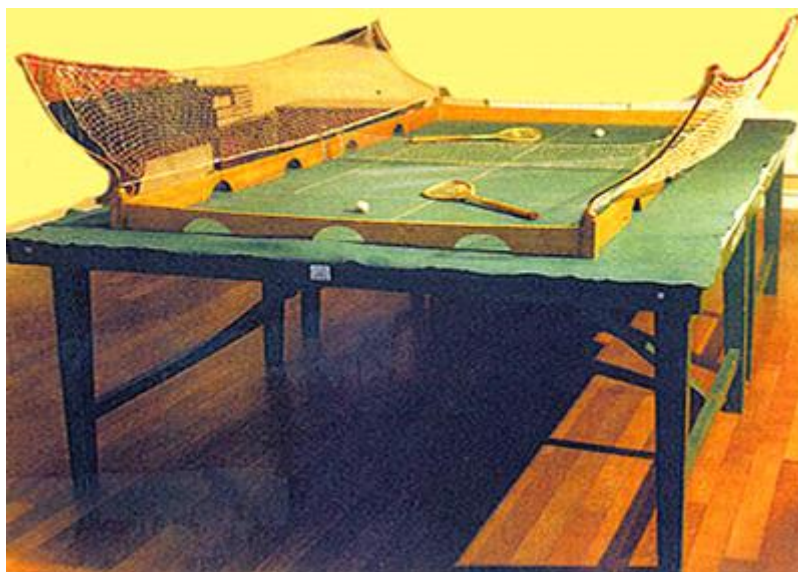
Рис. 7. Прадедушка современного стола для игры в настольный теннис

игра была известна под названием Госсима . Родилась она во второй половине XIX века как игра – развлечение.