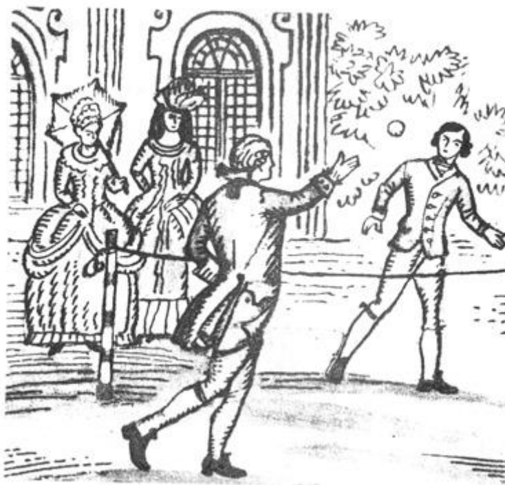
Рис. 1. Игра в мяч руками через ленту

Из всех многочисленных старинных игр с мячом родоначальником тенниса историки спорта называют тригон, известный со времен Древнего Рима, когда маленький твердый шар перебрасывался с одной стороны площадки на другую.