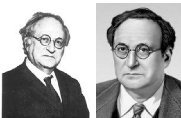
Рис.9. Первый президент международной федерации настольного тенниса Айвор Монтегю (Ivor Montgu 1904-1984)

Более 40 с лишним лет возглавлял ИТТФ Айвор Монтегю, который впоследствии был за тем единодушно избран пожизненным почетным президентом. Он много сделал для развития настольного тенниса во всем мире. В биографии А.Монтегю (Ivor Montgu, 1904-1984) было весьма много необычного и привлекательного и деятельность его была столь же многогранна. Зоолог по образованию, он с каким-то особым трепетом относился ко всему живому и был одним из соавторов первого издания Красной книги. Айвор Монтегю – английский коммунист, видный английский литератор, крупнейший киновед, страстный публицист, социолог, сценарист, в 30-х годах сражался добровольцем за свободу Испании. Он прогрессивный общественный деятель, член Всемирного Совета защиты Мира. Английский писатель Айвор Монтегю был, прежде всего, великим гуманистом (рис.9). В 60-е годы за активную позицию в киноискусстве, за укрепление мира между народами он становится лауреатом Ленинской премии борьбы за мир.