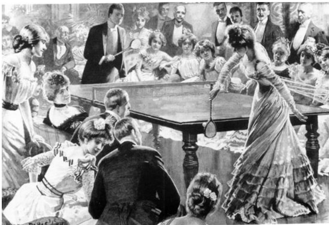
Рис. 8. Иллюстрация Люсьен Дейвис в газете Лондон ньюз , 1901 г.

Простой инвентарь, а главное – небольшие размеры площадки позволяли играть где угодно. Это обеспечило широкое распространение настольной игры, которая в короткие сроки стал излюбленной салонной игрой в Англии, а затем и в других странах Европы, Азии и Африки. Интересно, что игра велась в строгой вечерней одежде: женщины в длинных платьях, мужчины в смокингах и фраках.